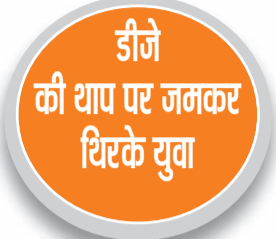
हरिभूमि न्यूज ॥ जींद

गुलाल के बहाने प्यार को बढ़ावा देने वाला तथा अधर्म पर धर्म की जीत का धुलेंडी पर्व बुधवार को जिलेभर में धूमधाम से मनाया गया। फोंग पर्व पर मारपीट की घटनाओं को छोड़ दिया जाए तो त्योहार शांतिपूर्ण रहा। इमरजेंसी को लेकर नागरिक अस्पताल में चिकित्सक तैनात रहे। वहीं पुलिस के 600 जवानों ने सुरक्षा व्यवस्था की कमान संभाली। त्योहार शांतिपूर्वक तरीके से मने, इसके लिए पुलिस पीसीआर शहर के साथ-साथ क्षेत्रभर में गश्त करती नजर आई। बावजूद इसके दिनभर लोग एक दूसरे पर रंग-गुलाल-अबीर डाल कर मस्ती में डूबे रहे। भाभियों ने भी देवरों पर जमकर कोरड़े बरसाए। वहीं, देवरों ने भाभियों पर जम कर पानी तथा गुलाल उड़ला। बुधवार को धुलेंडी के समय जगह-जगह