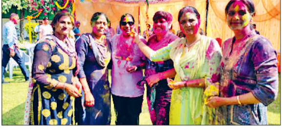
जींद। होली खेलते हुए पुलिसकर्मी।