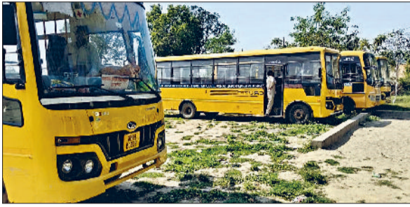
जींद। जांच करते परिवहन विभाग कर्मी।