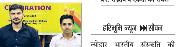
राजौद। कार्यक्रम बारे जानकारी देते हुए।

अंतरराष्ट्रीय महिला दिवस के अवसर पर 8 मार्च को अस्मिता लीग के अंतर्गत महिला खिलाड़ियों के लिए विभिन्न खेल प्रतियोगिताओं का आयोजन किया जाएगा। यह कार्यक्रम राजीव गांधी खेल स्टेडियम रोहेड़ा में प्रातः 9 बजे से शुरू होगा। यह आयोजन मेरा युवा भारत (माई भारत) कैथल, भारतीय खेल प्राधिकरण तथा जिला खेल विभाग कैथल के संयुक्त सहयोग से आयोजित किया जाएगा।