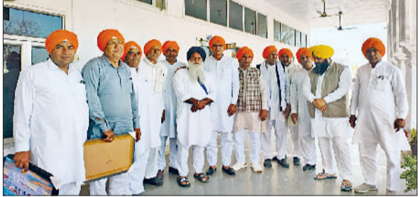
राजौड़। होली मिलन उत्सव पर गुरुद्वारा धनताम साहिब की कमेटी द्वारा हुल सरदारी को पगड़ी पहना कर सम्मानित करते हुए।

रखा गया है। युवाओं के लिए यह बजट नए रोजगार के अवसर पैदा करने का काम करेगा। यह बजट हरियाणा के लोगों का बजट है। इस बजट में अग्निवीरों को पुलिस में 20 प्रतिशत आरक्षण देने का काम किया