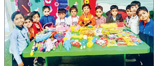
जींद। मोतीलाल स्कूल में होली पर्व खेलते हुए बच्चे।

रंगों का त्योहार होली प्रेम, भाईचारे और उल्लास का प्रतीक है। इसी भावना को आत्मसात करते हुए मोतीलाल नेहरू पब्लिक विद्यालय की सैपलिंग शाखा में होली का पावन पर्व अत्यंत उत्साह और उमंग के साथ मनाया गया। इस अवसर पर नर्सरी से यूकेजी तक के नन्हे-मुन्हे विद्यार्थियों ने रंगों की छटा बिखेरते हुए विद्यालय परिसर को खुशियों से सराबोर कर दिया। कार्यक्रम का आयोजन गतिविधि अधिकारी पूजा पसरीजा की देखरेख में विशेष रूप से छोटे बच्चों को भारतीय संस्कृति और परंपराओं से परिचित कराने के उद्देश्य से