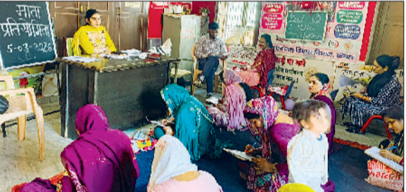
कलायत। सर्वोत्तम माता पुरस्कार के लिए लिखित परीक्षा देती महिलाएं।