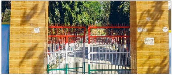
सीवन। गांव खानपुर स्थित राजकीय माध्यमिक विद्यालय का दृश्य।

खंड सीवन के गांव खानपुर स्थित राजकीय माध्यमिक विद्यालय ने मुख्यमंत्री सौंदर्यीकरण अभियान के अंतर्गत आयोजित जिला स्तरीय विद्यालय सौंदर्यीकरण प्रतियोगिता में उत्कृष्ट प्रदर्शन करते 390 अंक प्राप्त कर माध्यमिक विद्यालय वर्ग में प्रथम स्थान हासिल किया है। विद्यालय की इस उपलब्धि से गांव सहित पूरे क्षेत्र में खुशी का माहौल है और ग्रामीणों, अभिभावकों तथा शिक्षा विभाग के अधिकारियों ने विद्यालय परिवार को बधाई दी है। विद्यालय को यह सम्मान परिसर की