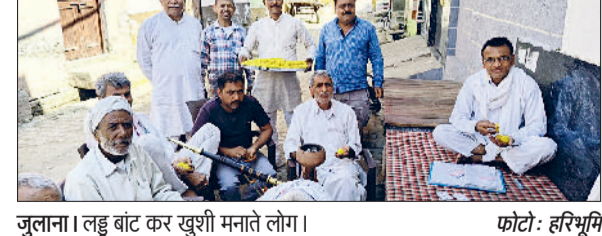
जुलाना। लड्डू बांट कर खुशी मनाते लोग।